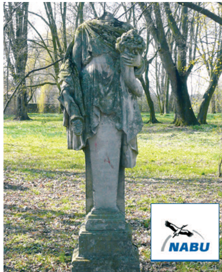
Parkansicht