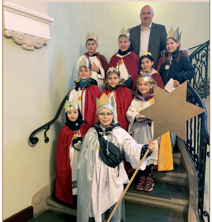
Besuch der Sternsinger im Altlandsberger Rathaus

(jk) Traditionell besuchen die Sternsinger der katholischen Pfarrgemeinde St. Hubertus aus Petershagen das Rathaus der Stadt Altlandsberg. In diesem Jahr besuchten sie die Stadtverwaltung am 4. Januar. Mit dem diesjährigen Motto „Gemeinsam für unsere Erde - in Amazonien und weltweit“ steht die Bewahrung der Schöpfung und der respektvolle Umgang mit Mensch und Natur im Fokus der bundesweiten Sternsingeraktion. Bei dem traditionellen Dreikönigssingen brachten die Kinder und Jugendlichen den Segnungsspruch „20*+C+M+B+24“ über der Tür des ehemaligen Ratssaals im Rathaus an. Der Segensspruch „Christus mansionem benedicat“ - "Christus segne dieses Haus" gibt jedem Menschen, der ein- und ausgeht, ein "Gott ist mit Dir" mit auf den Weg und begleitet sie durch das ganze Jahr.