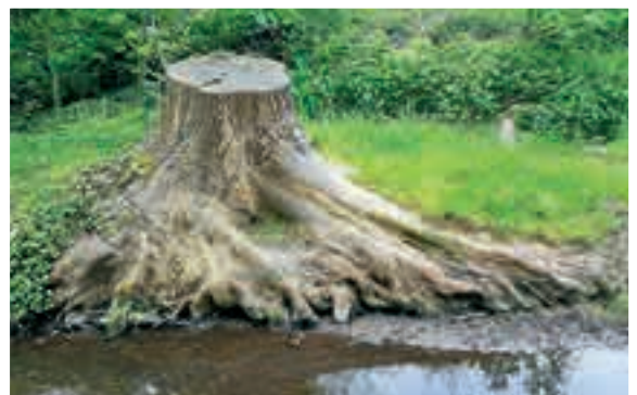
Wanderungen durch Altlandsberg