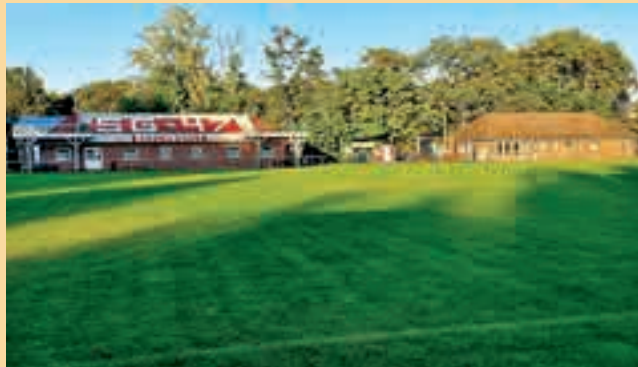
Der Erweiterungsbau der SG 47 Bruchmühle

Mit Stolz erfüllt uns, dass drei Nachwuchstalente unseres Vereines regelmäßig am DFB-Stützpunkttraining im DFB-Landes-Leistungszentrum-Rehfelde teilnehmen. Schon in den letzten Jahren konnten zahlreiche Spielerinnen und Spieler dort mit ihren sehr guten Leistungen wesentlich zum Erfolg der einzelnen Auswahlmannschaften beitragen.