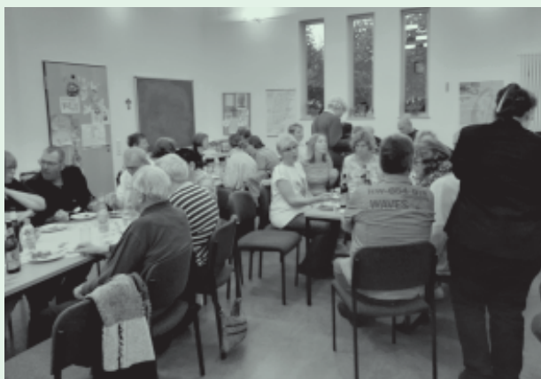
Text und Foto: Hans-Peter Staps

Nach der Chorprobe trafen sich die geladenen Gäste in der Winterkirche zu einem gemütlichen Beisammensein. Sie ließen sich die leckere