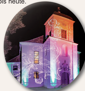
Schlosskirche Altlandsberg

(rh) Die Fördergesellschaft bietet wieder ab Ende März Führungen über das Schlossgut-Gelände an. Jeweils von März bis Oktober finden die Führungen zeitgleich mit dem Frischemarkt ab 14:00 Uhr statt. Treffpunkt ist vor der Stadtinformation, für die Führungen ist eine Teilnahmegebühr von fünf Euro zu zahlen. Die Tickets hierfür können in der Stadtinformation im Voraus erworben werden. Die Führungen beinhalten Geschichten und Anekdoten zur Entstehung des Schlossguts sowie Einblicke und Ausblicke in die historische und die neue Entwicklung bis heute.